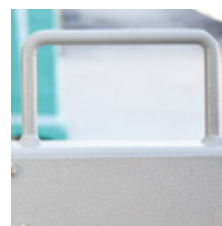
Asa de fácil transporte