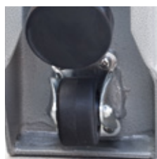
Ruedas de transporte